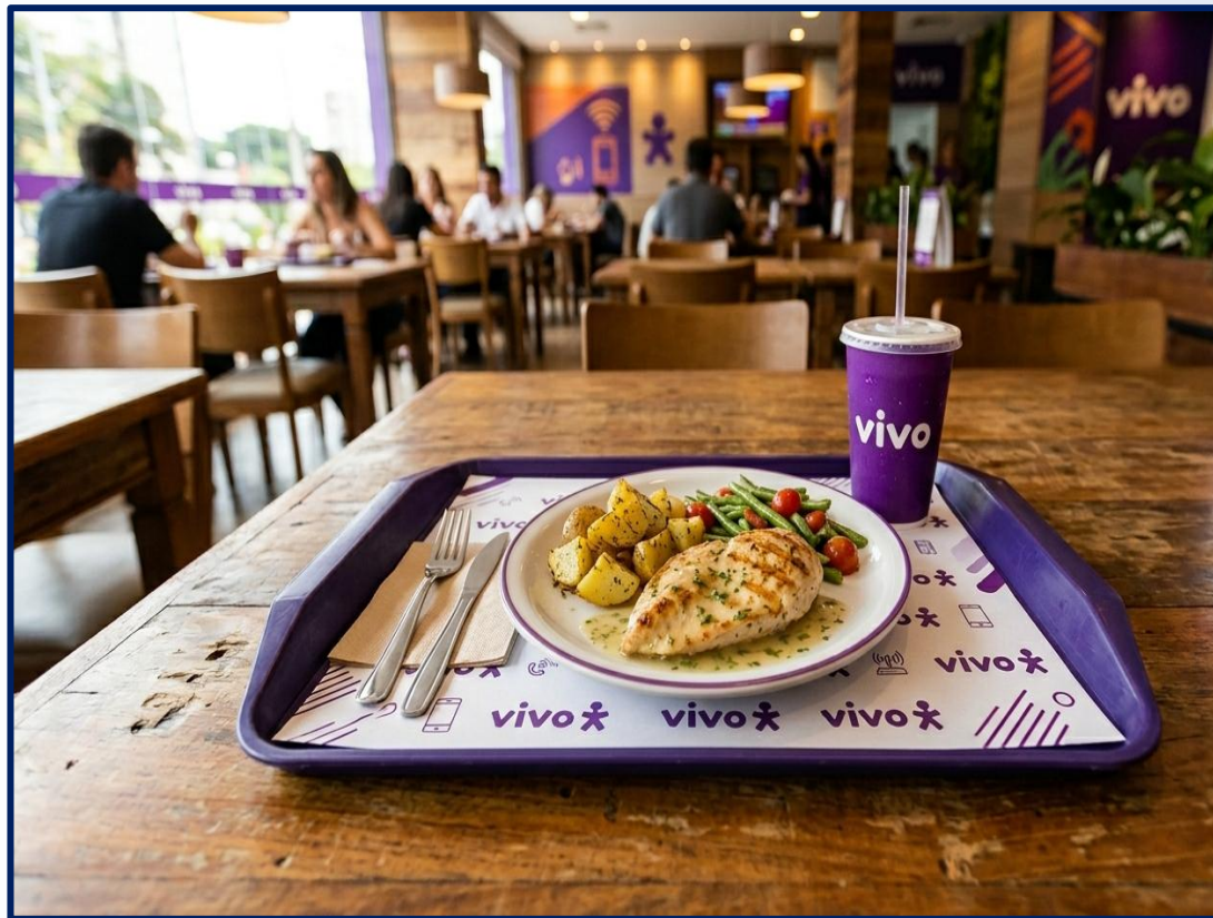
Exposição no restaurante da unidade