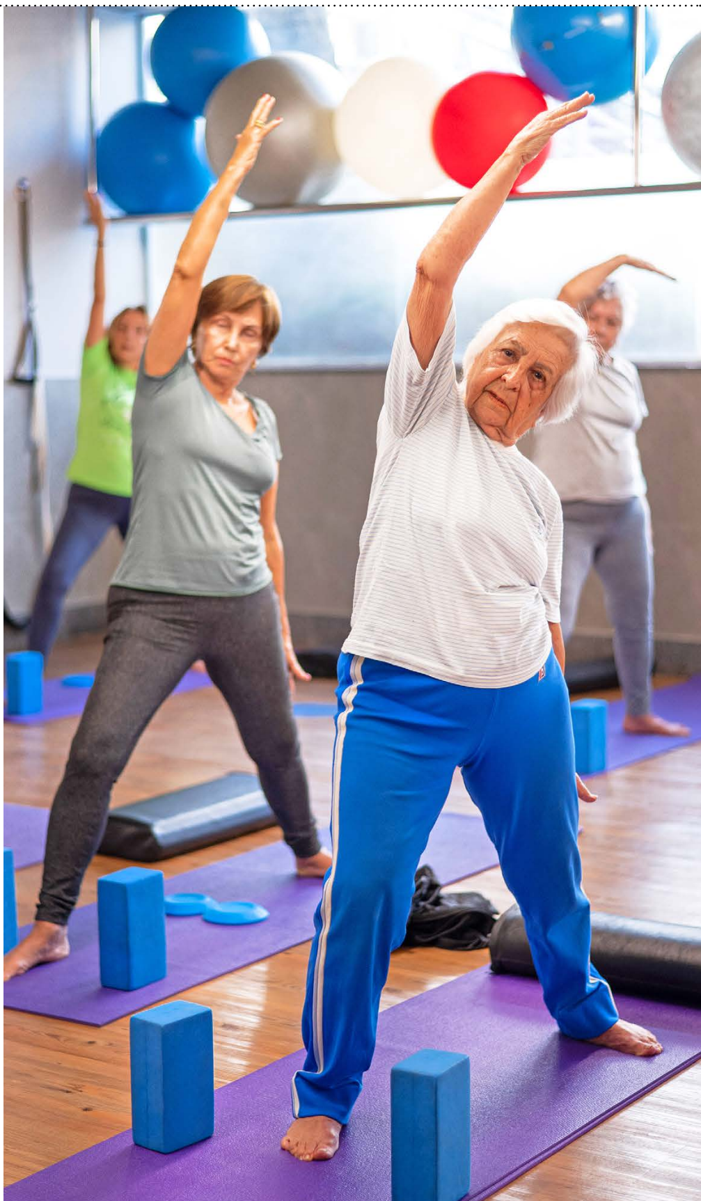
Yoga Balance inclui posturas mais dinâmicas

Praticar Yoga também pode proteger o cérebro contra o declínio cognitivo, segundo estudo realizado pelo Instituto Irsaelita de Ensino e Pesquisa Albert Einstein, da Universidade Federal do ABC e da Harvard Medical School. A pesquisa aponta que mulheres idosas praticantes da atividade possuem um córtex pré-frontal mais espesso em regiões associadas à memória. Isso quer dizer que, da mesma forma que o músculo cresce com a atividade física, o cérebro pode apresentar adaptações positivas com a prática.