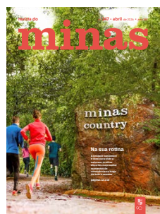
Edição 247 Abril de 2026

A Revista do Minas está disponível também no site minastenisclube.com.br