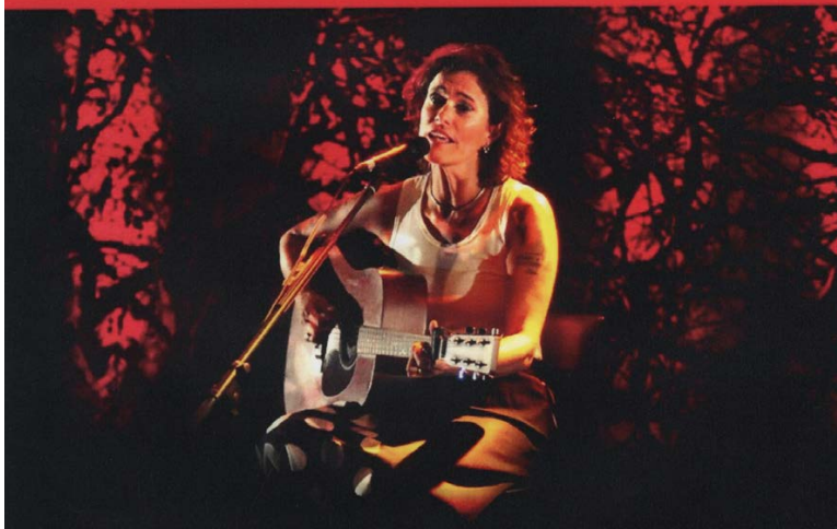
Zélia Duncan foi a primeira artista a se apresentar no projeto, em 2016 (peça de divulgação da época)