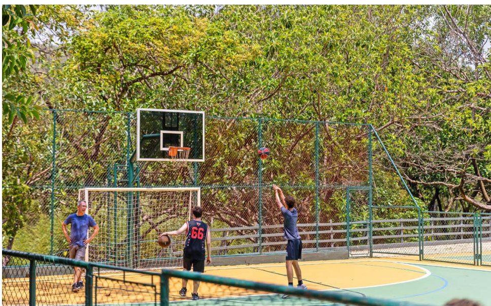
Quadras esportivas ambientadas pelo verde