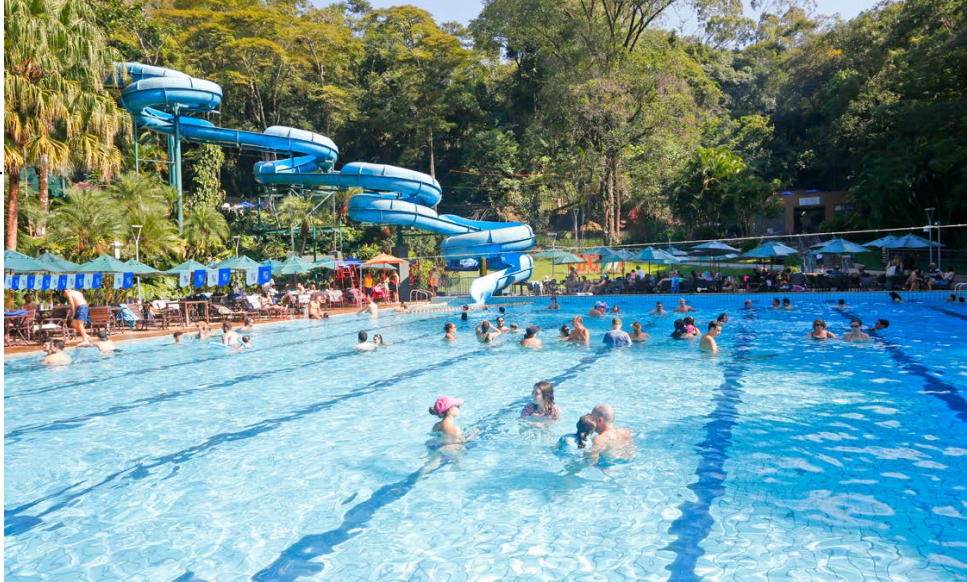
Piscina de baixo com o maior tobogã do Minas

Segunda-feira: fechado Terça, quinta e sexta-feira: 9h às 17h Quarta-feira: 9h às 22h Sábado: 7h às 21h Domingo e feriado: 7h às 19h