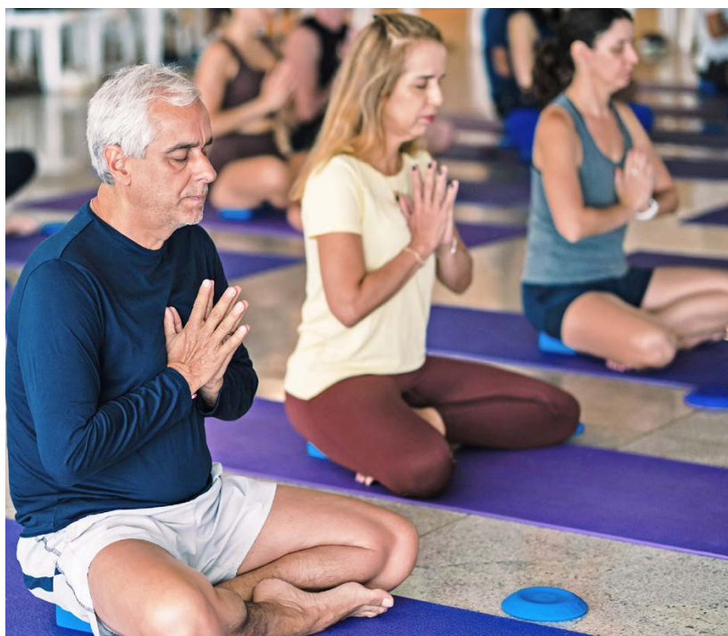
Momento de concentração no Yoga Free