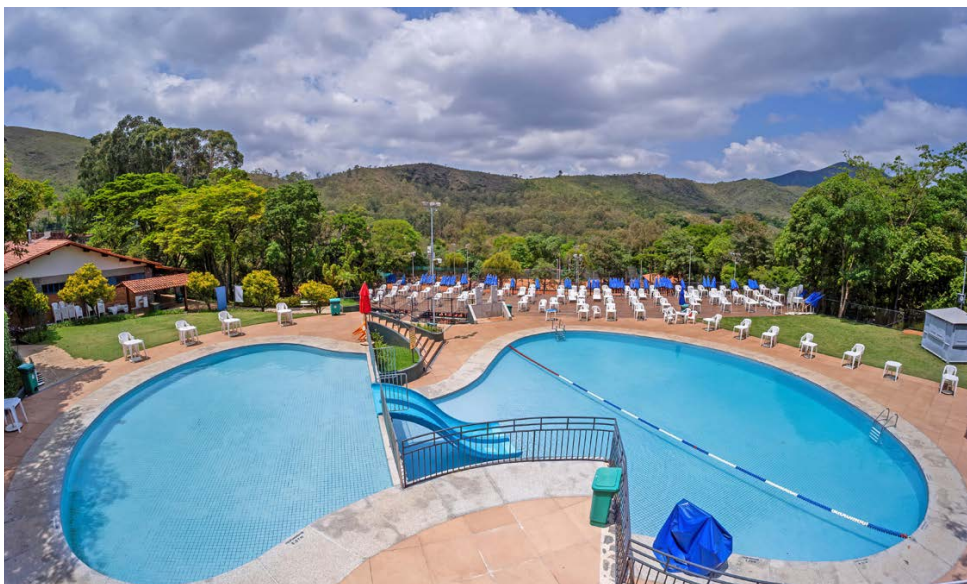
Piscina de cima é rodeada por serra e tem vista para as quadras esportivas