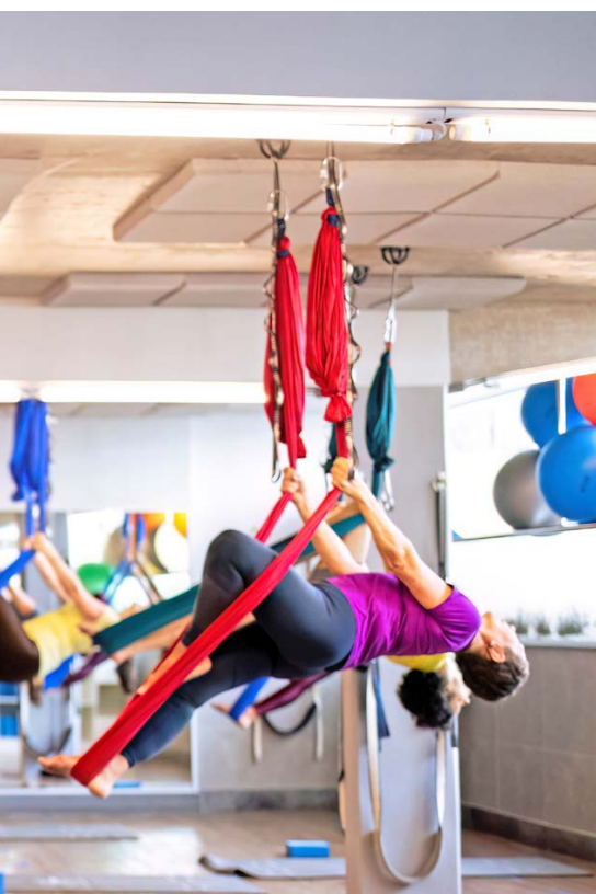
Yoga Aéreo, modalidade recém incluída no programa do curso